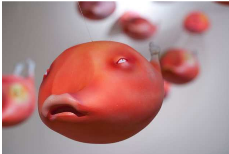
展示風景 / 2014年 / ポリキャスト