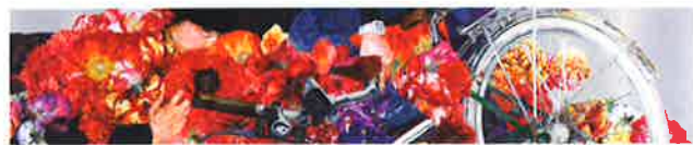
岩田壮平「雪月花時最憶君一花泥棒」全図