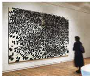
浅見貴子《Matsu 7》2003年 250×360cm