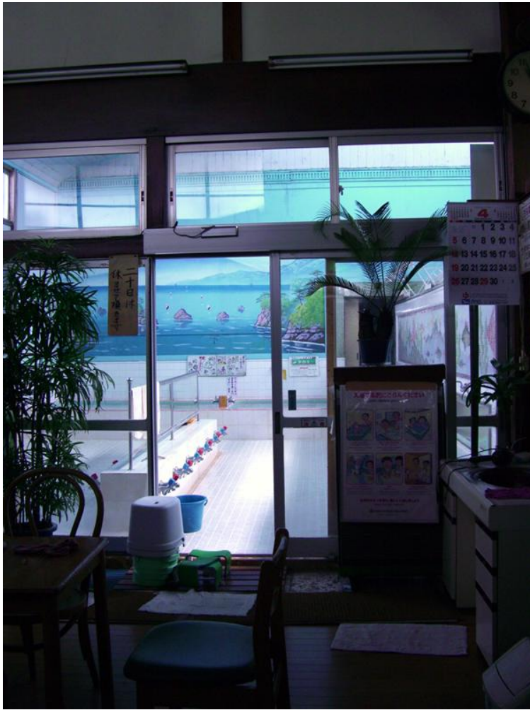
入口方向から風呂場を見る。