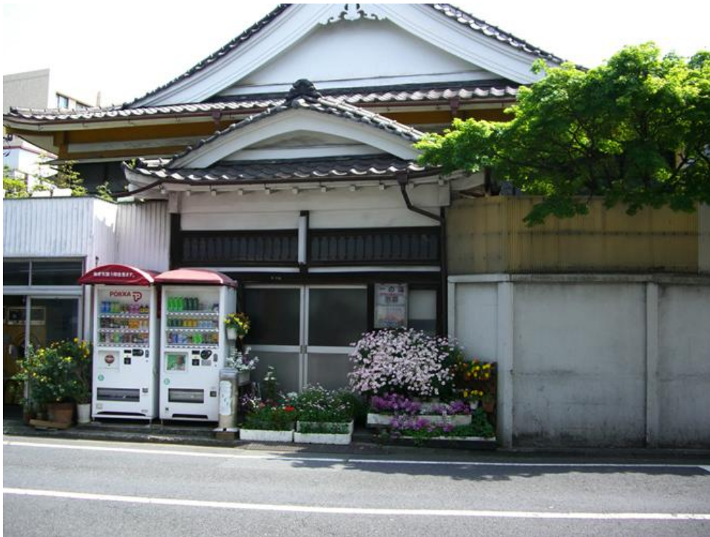
表入口。開店時はドアの前の花は移動されて出入りができます。